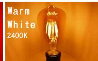
Warm White 2400K